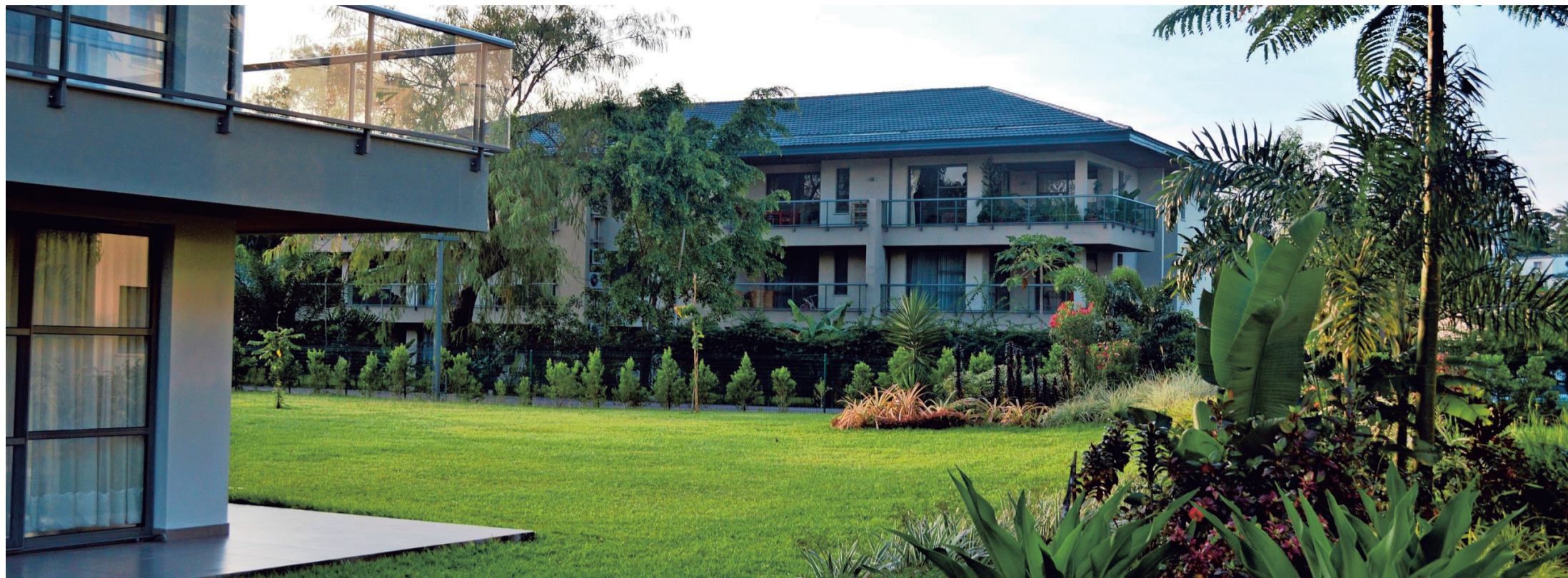
Texaf bouwt appartementen, huizen en kantoren in hartje Kinshasa.

T exaf, vroeger Textiles Africains, mag een succesverhaal worden genoemd. De beurswaarde van de holding groeide van amper enkele miljoenen euro's in de jaren negentig naar 135 miljoen euro vandaag. In zowat twintig jaar vormde het zich om van een ter ziele gegane Afrikaanse textielgroep tot een florierende vastgoedontwikkelaar in Kinshasa, de hoofdstad van de Democratische Republiek Congo (DRC). Ook gisteren schitterde het aandeel van de investeringsmaatschappij. Het klom bijna 8 procent naar 42 euro. Maar Texaf beleeft woelige tijden. Geen etnische rellen of een machtsgreep zetten Texaf dit keer op stelten, maar een overnamebod.